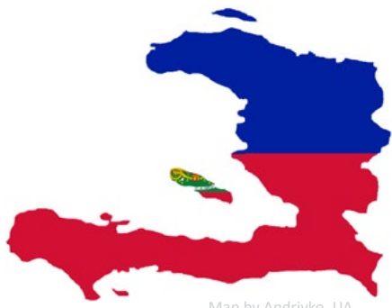
Map by Andriyko_UA