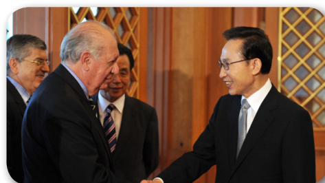
Myung-bak, Presidente de la República de Corea, con los miembros del Club de Madrid César Gaviria, Presidente de Colombia (1990-1994), Ricardo Lagos, Presidente de Chile (2000-2006) y Han Seung-soo, Primer Ministro de Corea del Sur (2008-2009)

proceso que desemboque en una arquitectura de gobernanza internacional más representativa y sostenible, capaz de responder a las causas sistémicas y a los efectos de la crisis. El G20 debe demostrar que no es un nuevo foro de viejas voces que da poder a las grandes potencias en detrimento de un multilateralismo verdadero. Debe ser apoyado en este proceso para asegurar que sirve como un mecanismo efectivo de transición que nos lleve de un multilateralismo informal a uno institucionalizado, algo necesario para abordar las necesidades del siglo XXI.